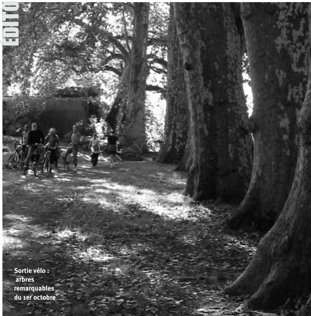
Sortie vélo : arbres remarquables du 1er octobre

association de cyclistes urbains de l'agglomération nantaise