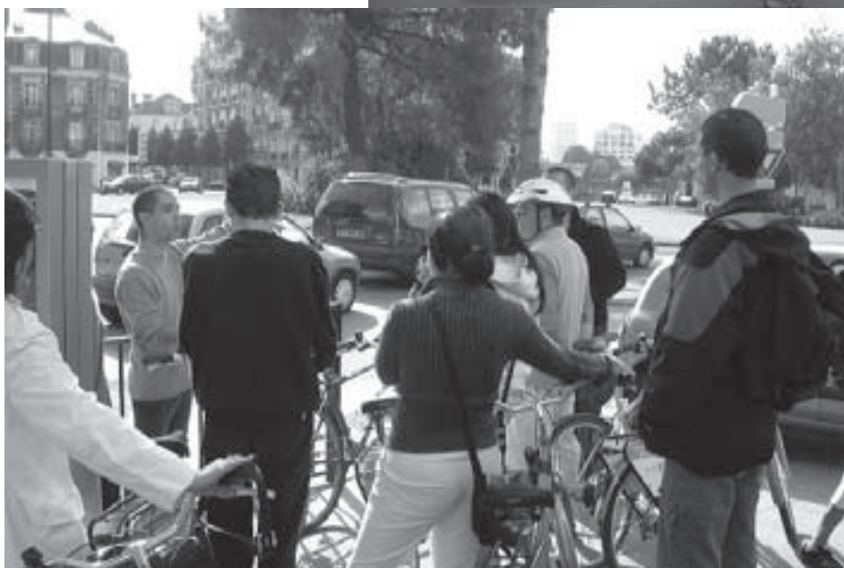
Avant d'attaquer le rond-point Place de la République.

Nous aurions préféré qu'elle soit complètement libérée des voitures et que la zone animée ne soit pas entourée de barrières. Le côté positif, en plus du soleil, c'est le succès du village de la mobilité qui rassemblait les associations mobilisées pour proposer des alternatives au tout-voiture. Chacune a recensé plus deux cent visiteurs prêts à s'impliquer, sans compter les autres.