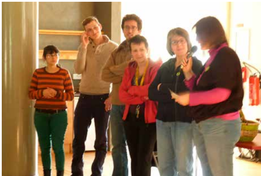
« Ze plombier » ; « A 4 mains » ; « Croquinelle »