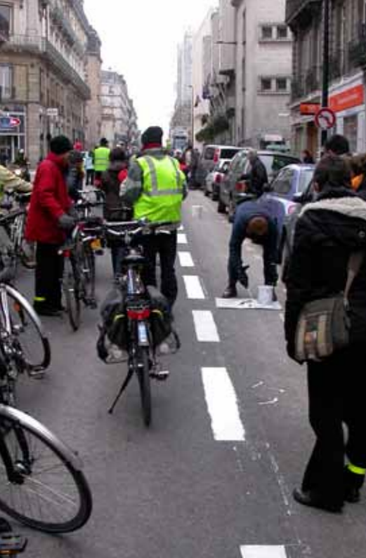
Pour une bande cyclable rue de Strasbourg