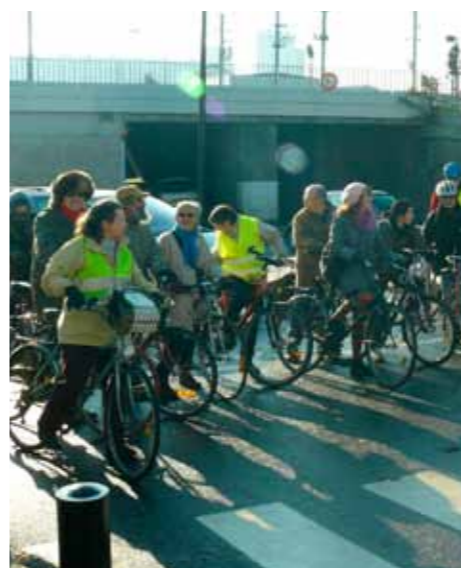
La Moutonnerie : les cyclistes de PAV réclament d'urgence un sas vélo

Après débats sur le document de travail de Nantes Métropole qui ambitionne d'augmenter les déplacements cyclistes, Place au Vélo a proposé les mesures suivantes. Elles complètent les propositions déjà listées dans la BL n°76 de septembre 2009 qui visaient à rendre accessible la voirie publique à tout enfant en âge d'entrer au collège pour qu'il puisse se déplacer seul à vélo pour ses activités quotidiennes. Actuellement, la circulation urbaine effraie les parents qui ne peuvent laisser leurs enfants utiliser leur vélo pour leur déplacement domicile école ou domicile loisirs ; elle effraie aussi beaucoup d'autres personnes qui souhaiteraient se déplacer en vélo.