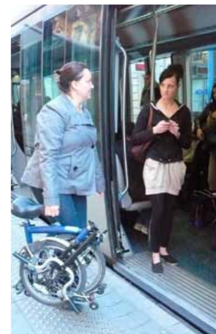
Exemple de vélo pliant facilitant l'accès aux transports en commun à vélo!

• Les associations représentant les usagers seront concertées systématiquement sur les aménagements nouveaux et les actions menées au titre de l'engagement vélo de Nantes Métropole.