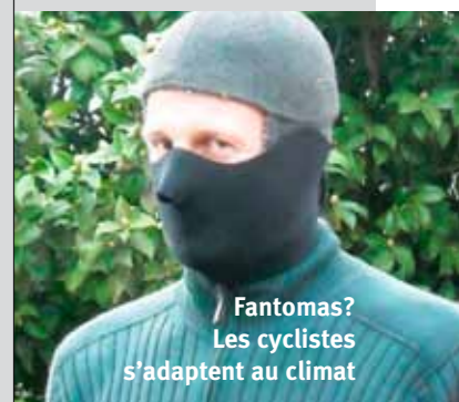
Fantomas? Les cyclistes s'adaptent au climat