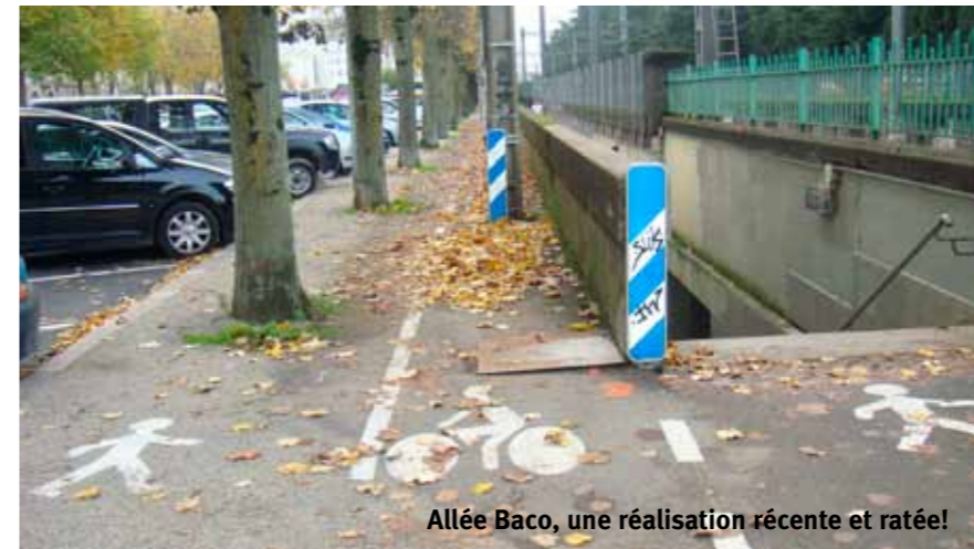
Allée Baco, une réalisation récente et ratée!

Location de 60 vélos pliants aux abonnés des transports en commun pour compléter leur trajet. Location de vélos à la journée dans certains TC : 3 pôles en 2010