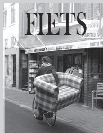
La place du vélo dans la culture néerlandaise