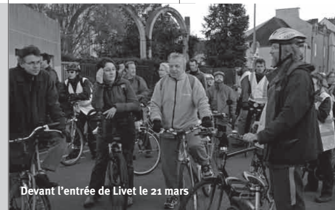
Devant l'entrée de Livet le 21 mars