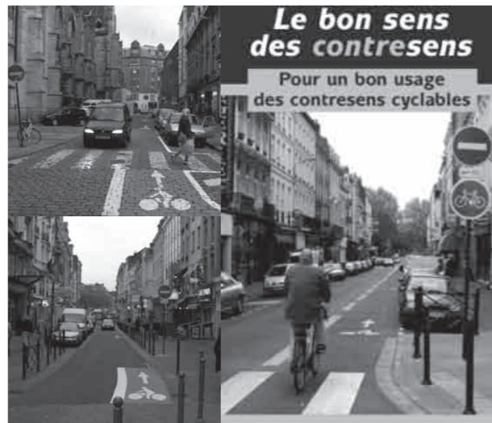
Des exemples Lillois et l'excellent dépliant disponible au local.

Il est beaucoup plus facile de lancer une campagne de communication et de sensibilisation intensive sur l'évolution de la règle quand elle est généralisée (tous les sens uniques = double sens vélo, sauf cas particulier de carrefours avec plusieurs rues à plusieurs voies). On passe ainsi bien plus rapidement au régime « sécurisant » où cette règle est intégrée par l'ensemble des usagers, qui penseront à regarder des 2 côtés quand ils abordent un « double sens cyclable ». Lorsque la règle