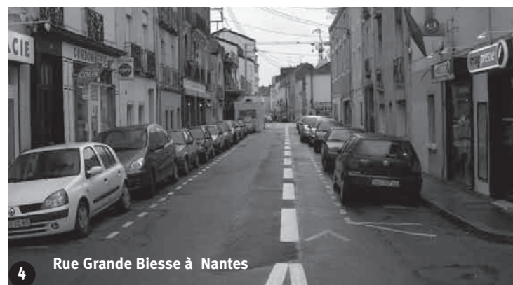
Rue Grande Biesse à Nantes

Quand on parle de contresens cyclable aux non cyclistes qui ne connaissent pas ce concept, leur première réaction est en général : « mais c'est très dangereux ! » Cet aménagement effraie également les élus français alors qu'il est très répandu dans les pays d'Europe du Nord, pourtant particulièrement soucieux de la sécurité des nombreux cyclistes qui y circulent.