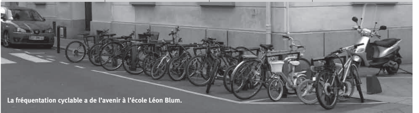
La fréquentation cyclable a de l'avenir à l'école Léon Blum.