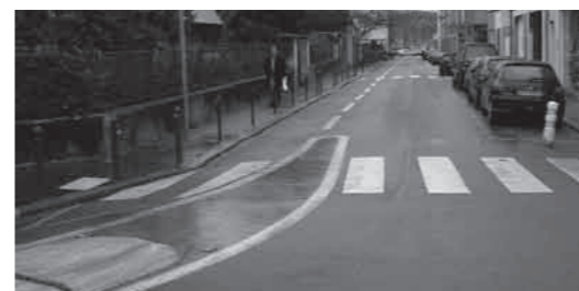
Vous la reconnaissez? c'est la piste de la rue d'Auvours.

A Strasbourg, 40% des sens uniques sont autorisés à contresens pour les vélos (environ 200 rues). Après trois ans de mise en service, il y a eu moins d'accidents dans ces rues que dans les autres. A Illkirch, le contresens cyclable a été généralisé dans toute la ville. A Dijon, voir en page 2. Chez nos voisins belges, les double-sens cyclables, appelés sens uniques limités (SUL) sont la règle dans les rues à sens unique depuis le 1er janvier 2004. Les contresens cyclables sont devenus complètement banals dans de nombreuses villes d'Europe, ils sont très appréciés des cyclistes et se révèlent très sûrs.