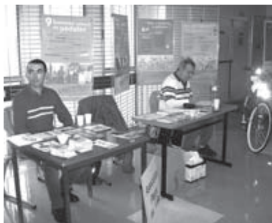
Le stand PAV au CHU