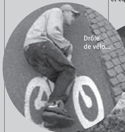
Drôle de vélo...