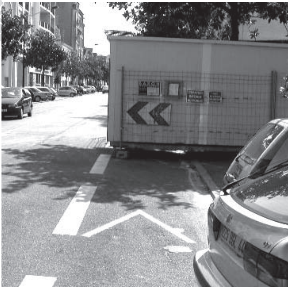
Boulevard Meusnier de Querlon à Nantes: actuellement le vélo et les piétons sont pour plusieurs mois dans l'impasse.