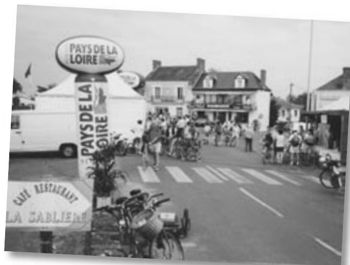
Interprétation des comptages FdV2 - Thouaré Sud Nombre de cyclistes en 10 minutes