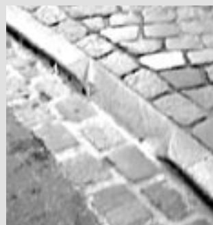
Rabotage d'une bordure à Lille.

Dans le cadre de son plan de déplacements d'entreprise la CUB (Communauté Urbaine Bordelaise) vient d'acquérir 40 vélos. 30 pour les déplacements domicile-travail et 10 pour les déplacements professionnels. Incroyable ! ... Pour leur premier essai de ramassage scolaire, ils ont réussi à le rendre quotidien depuis le début mai jusqu'à la fin de l'année scolaire. Ainsi tous les jours 32 enfants de l'école Jacques-Prévert de Bruges vont à vélo à l'école. Il faut dire que la ville les a bien aidés en finançant l'équipement (casques et chasubles fluo) et surtout en mettant à la disposition un appareteur.