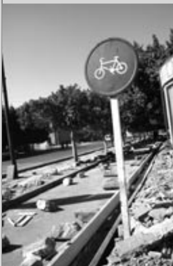
Vu à Marrakech : là-bas aussi les pistes cyclables sont monopolisées... pendant les travaux!