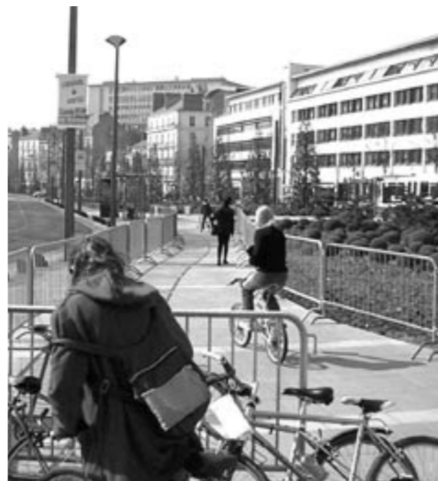
Nouveauté pour cette seconde bourse, une piste d'essai fort appréciée.

Vente de vélos: 121 vélos vendus → 70 vendus par PAV et 51 vélos vendus par ATAO. Bénéfice pour PAV : 429,33 €. Et 10 adhésions à Place au Vélo.