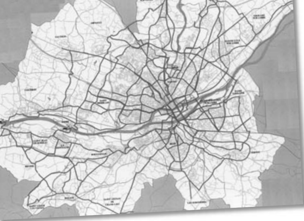
Le réseau structurant (410 km dont 70 réalisés).

sécurité) et surtout de le faire savoir. C'est une rupture, mais qui consacre la transition du réseau cyclable nantais vers la maturité. Certes un schéma directeur reste un outil qui guidera les techniciens et nous continuerons à y apporter nos remarques. Mais les élus, comme le grand public, ont besoin de projets phares. Place au Vélo fait quelques propositions que l'on peut interpréter comme une « priorisation » des actions. Dans l'espoir que la communauté urbaine redeviendra ambitieuse pour le déplacement à vélo.