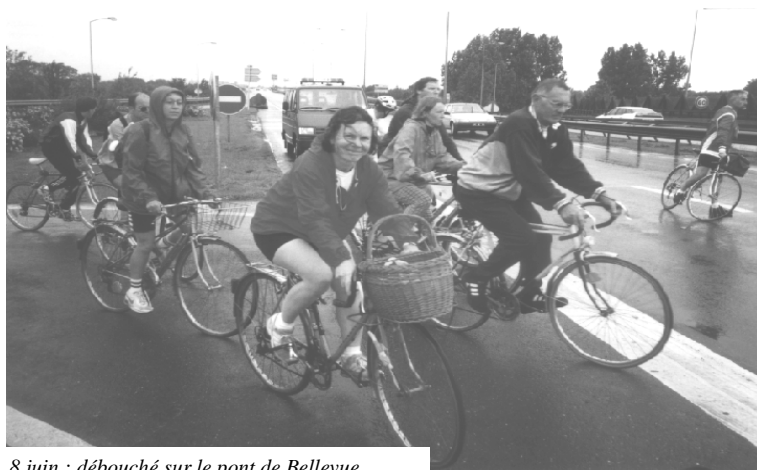
8 juin : débouché sur le pont de Bellevue

Une offre de stationnement en parkings fermés va être proposée. En 97, il sera installé des consignes à vélos dans le parking de la gare nord (30 places), une expérimentation de garage à vélos fermé (15 places) sera lancée. En 98, il sera installé deux nouveaux garages à vélos fermés.